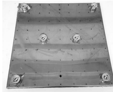
Imagem 1 (Base Inox)