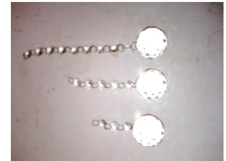
Imagem 3 (Pêndulo de Cristal)