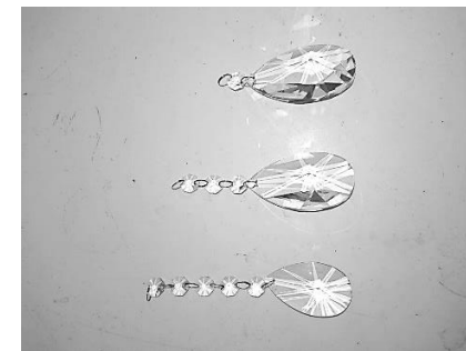
Imagem 3 (Pêndulo de Cristal)