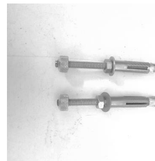
Imagem 2 (Fixador Parabolts)