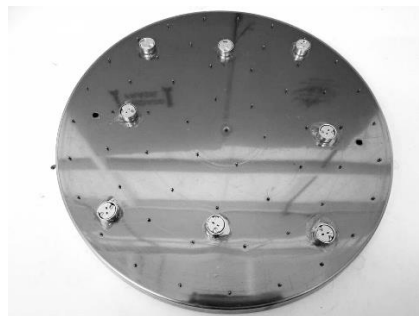
Imagem 1 (Base Inox)